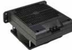
HVI 030 500 W - 700 W