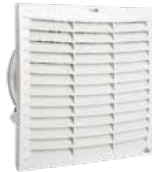
FPI 018 / FPO 018 bis 1010 m 3 /h (291 x 291 mm)