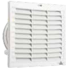
FPI 018 / FPO 018 bis 536 m 3 /h (223 x 223 mm)