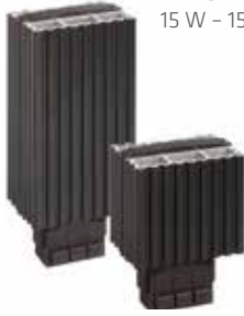
HG 140 15 W - 150 W