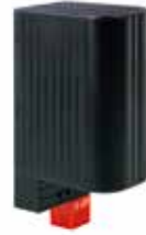
CSF 060 50 W - 150 W