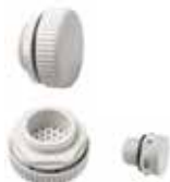
DA 284 (Kunststoff) IP66 / IP67