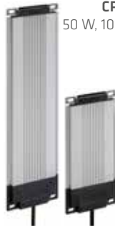
CP 061 50 W, 100 W, 120 W