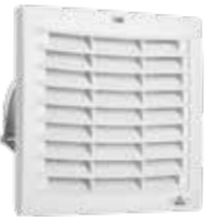
FPI 018 / FPO 018 bis 263 m 3 /h (176 x 176 mm)