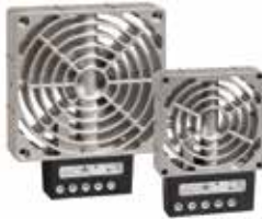
HV 031 / HVL 031 100 W - 400 W