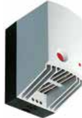
CR 027 bis 650 W