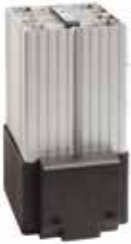
HGL 046 250 W - 400 W