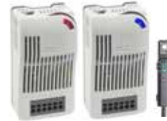
DCT 010 DC 20 - 56 V