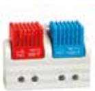
FTD 011 (Öffner und Schließer)