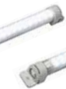
LED 021 (400 mm)