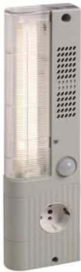
Luminaria con sensor de movimiento y toma de corriente integrada (Alemania), Art.No. 02520.0-03